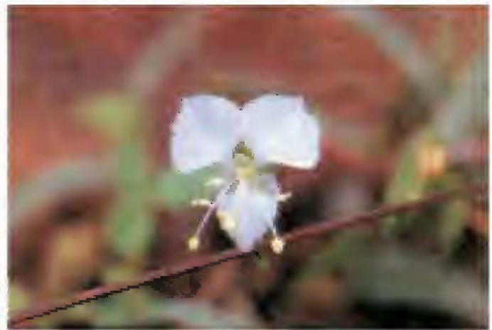
Fig. 2. A. Commelina nivea López-Ferrari, Espejo et Ceja. B. Commelina rzedowskii López-Ferrari, Espejo et Ceja.